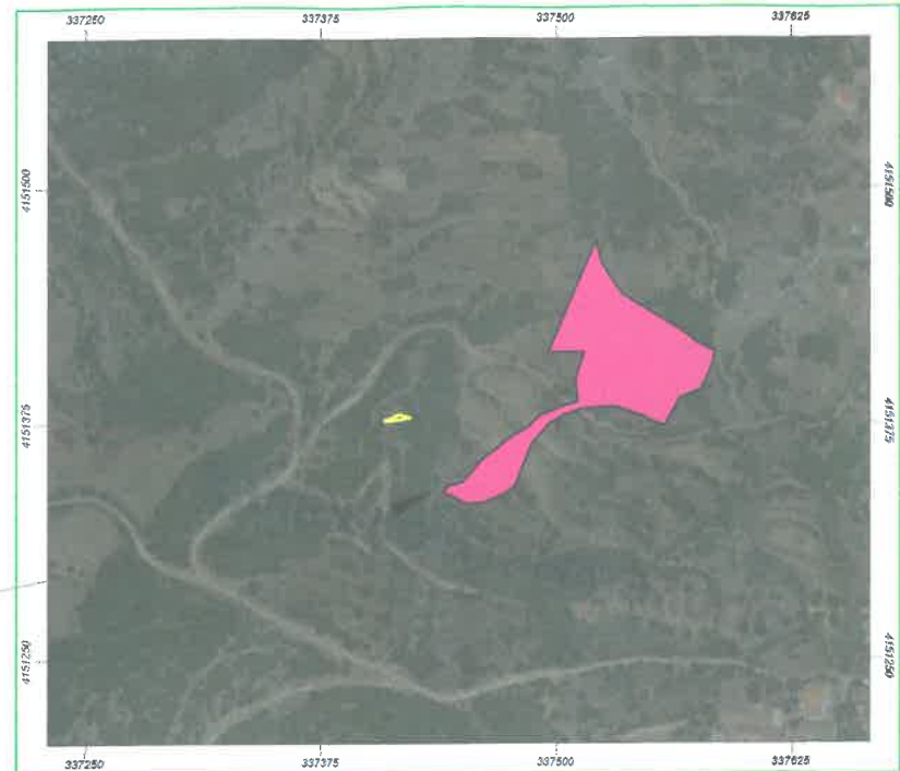
ΑΠΟΣΠΑΣΜΑ ΔΑΣΙΚΟΥ ΧΑΡΤΗ ΚΤΗΜΑΤΟΛΟΓΙΟΥ ΕΚΧΑ Α.Ε.

ΕΚΤΟΣ ΣΧΕΔΙΟΥ ΔΟΜΗΣΗΣ ΟΡΟΙ ΔΟΜΗΣΗΣ ΠΛ 24/31-5-85(ΘΕΚ 270Α) ΑΠΑΙΤΟΥΜΕΝΟΙ ΕΜΒΑΔΟΝ = 4000.00 Μ 2 ΠΡΟΣΩΠΟ = 45.00 Μ ΠΛΑΤΟ ΟΡΟΙ = 50.00 Μ ΚΑΛΥΨΗ = 200.00 Μ 2 1200.00 Μ 2 ΔΟΜΗΣΗ = 200.00 Μ 2 ΠΡΟ 1962 ΠΛΑΤΟ ΟΡΟΙ = 16.00 Μ ΥΨΟΣ = 7.50 Μ ΣΤΕΓΗΣ = 1.20 Μ ΥΨΟΣ ΑΡ. ΟΡΟΦΩΝ = 2 5.00 Μ ΕΓΚ. 4480/29-1-04 ΑΡΘΡΟ 10 ΠΑΡ. 1 ΕΛΛΗΣΤΟ ΠΡΟΣΩΠΟ 26.00 Μ ΣΕ ΚΟΙΝΟΧΡΗΣΤΟ ΔΡΟΜΟ. ΓΙΑ ΚΑΤΑΤΜΗΣΗ ΟΙΚΟΠΕΔΩΝ ΜΕΤΑ ΤΗΝ 31-12-03.