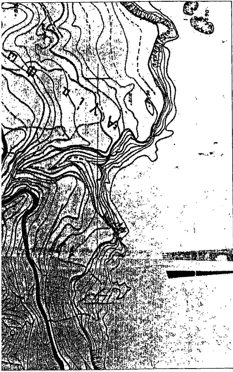
ΑΠΟΣΠΑΣΜΑ ΔΙΑΓΡΑΜΜΑΤΩΝ ΓΥΣ 1:5000 (Φ. 96465,96466,96467,96468 )