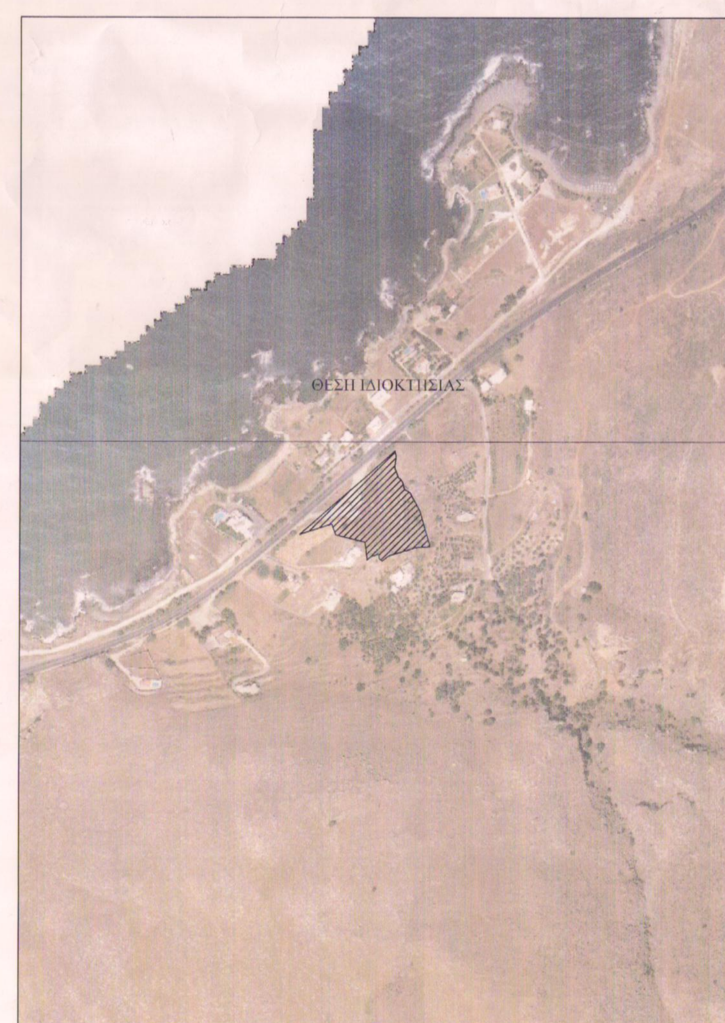
ΑΠΟΣΠΑΣΜΑ ΧΑΡΤΗ ΚΛΙΜΑΚΑ 1:5000

Ε 1 : 4.935,58 τ.μ. Χ: 533142,09 Υ: 3912033,47 Χ: 533132,25 Υ: 3912011,68