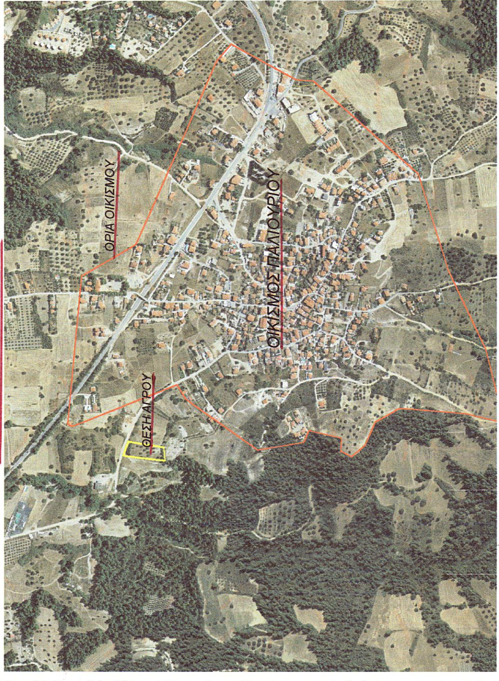
ΥΠΕΥΘΥΝΗ ΔΗΛΩΣΗ ΝΟΜΟΥ 651/77

Η υπογεγραμμένη Μηχανικός Γεωπληροφορικής και Τοπογραφίας ΧΑΡΙΚΛΕΙΑ Χ. ΚΟΡΔΕΛΑ Διπλώμα Υπεύθυνα ότι ο αγρός υπο στοιχεία (ΑΒΓΔΕΖΗΘΑ) Εμβαδού 3560,20 τμ Εντός Ζώνης είναι άριστος και οικοδομήσιμος σύμφωνα με τις ισχύουσες Πολεοδομικές Διατάξεις Π.Δ. 1-7-77 ΦΕΚ 290 Δ/1-9-77 Π.Δ. 24-5-85 (ΦΕΚ 270Δ/31-5-85). Δεν υπάγεται στις Διατάξεις του Ν. 1337/83, δεν έχει υποχρεώσεις εισφοράς σε γη και χρήμα και δεν έχει κυρωθεί πράξη εφαρμογής Πολεοδομικής Μελέτης. Δεν υπάγεται στις διατάξεις του Ν.2308/85 περί Εθνικού Κτηματολογίου. Ευρίσκεται σε προτεινόμενη περιοχή Σχεδίου Χωρικής και Οικιστικής Οργάνωσης Ανοικτής Πόλης (Σ.Χ.Ο.Α.Π.) ΦΕΚ 1687/ΑΑΠ 10-5-2012 και συγκεκριμένα ανήκει σε Περιοχή με κωδικό αριθμό ΠΕΠΔ-ΛΠΤ (Περιοχή Ελέγχου και περιορισμού Δόμησης Λοιπή Γεωργική Γη). Απέχει δε 2335 μ περίπου από την θάλασσα και 300 μ. περίπου από τα όρια της ΤΥΚ Παλαιούριου.