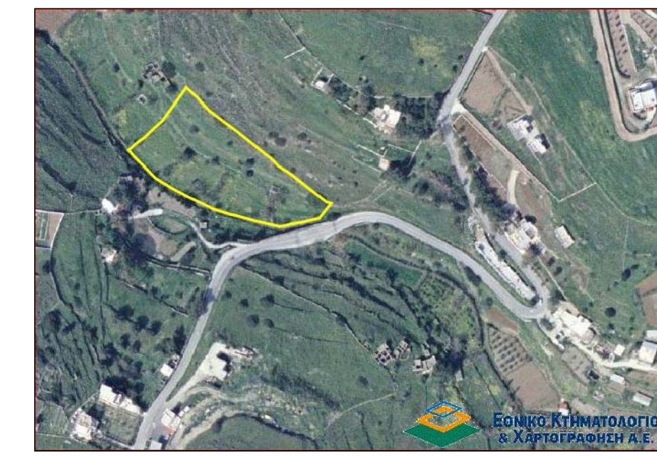
Απόσπασμα απο χάρτες κτηματολογίου

ΑΠΟΚΕΝΤΡΩΜΕΝΗ ΔΙΟΙΚΗΣΗ ΑΙΓΑΙΟΥ ΔΙΕΥΘΥΝΣΗ ΔΑΣΩΝ Π.Ε. ΚΥΚΛΑΔΩΝ Θεωρείται το παρόν τοπογραφικό διάγραμμα και αποτελεί αναπόσπαστο μέρος της αρ. πρ. 78214/ 2014Πράξης Χαρακτηρισμού Ερμούπολη, 17.10.2014