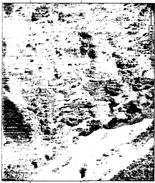
ΑΠΟΣΠΑΣΜΑ ΧΑΡΤΙΟΥ Γ.Υ.Σ. ΚΛΙΜΑΚΑ 1 / 50000