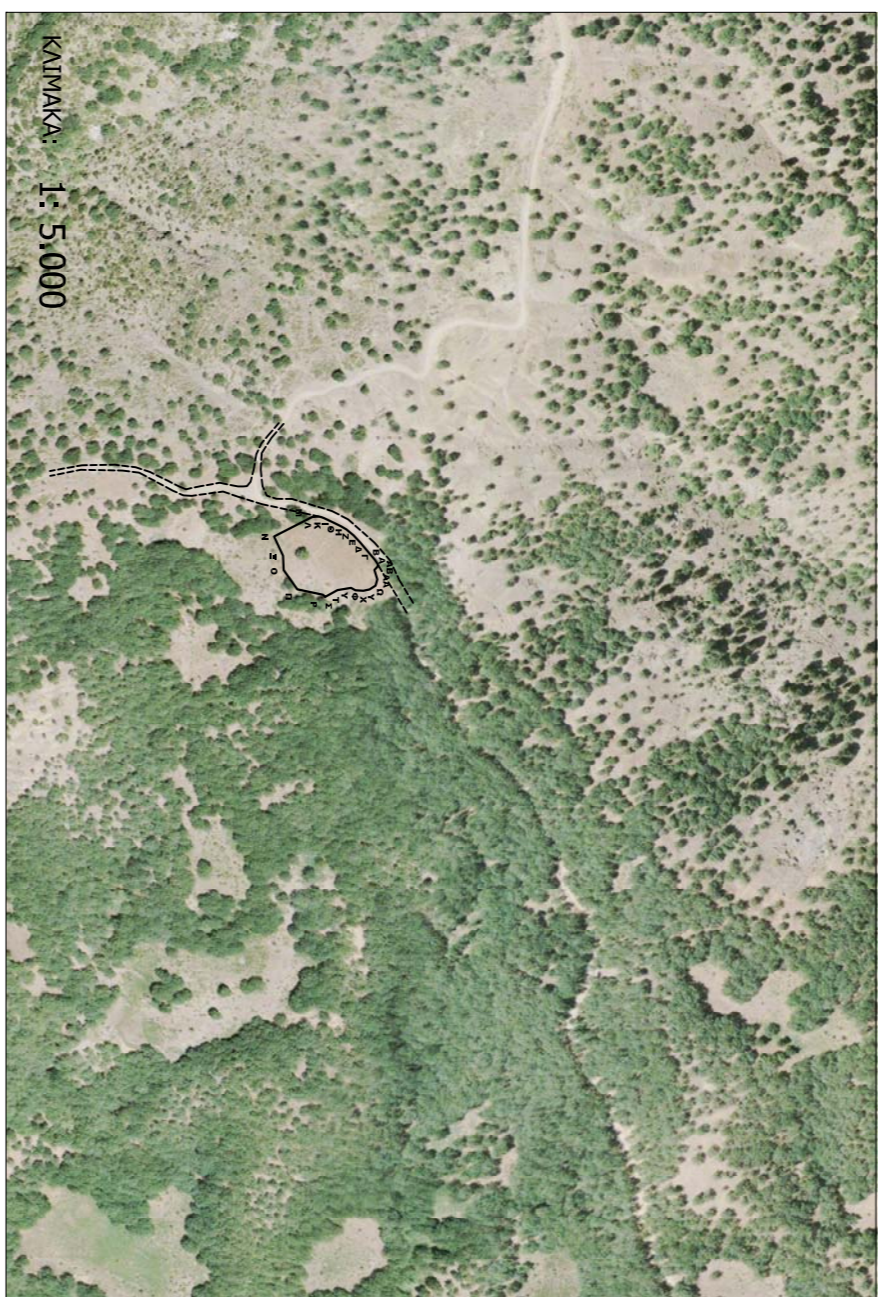
ΤΟΠΟΓΡΑΦΙΚΟ ΥΠΟΒΑΘΡΟ ΟΡΘΟΡΘΟΓΩΝΙΑΣ ΜΕ ΑΡΙΘΜΟ 332-257