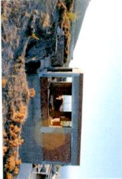
Εικ. 2 Ανατολική άποψη ακινήτου.