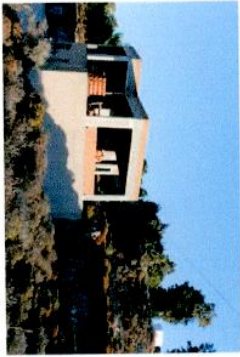
Εικ. 1 Δυτική άποψη ακινήτου.