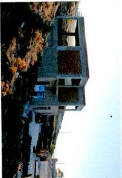
Εικ. 3 Ανατολική άποψη ακινήτου.