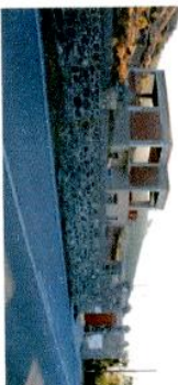
Εικ. 4 Άποψη πρόσδεσης ακινήτου.