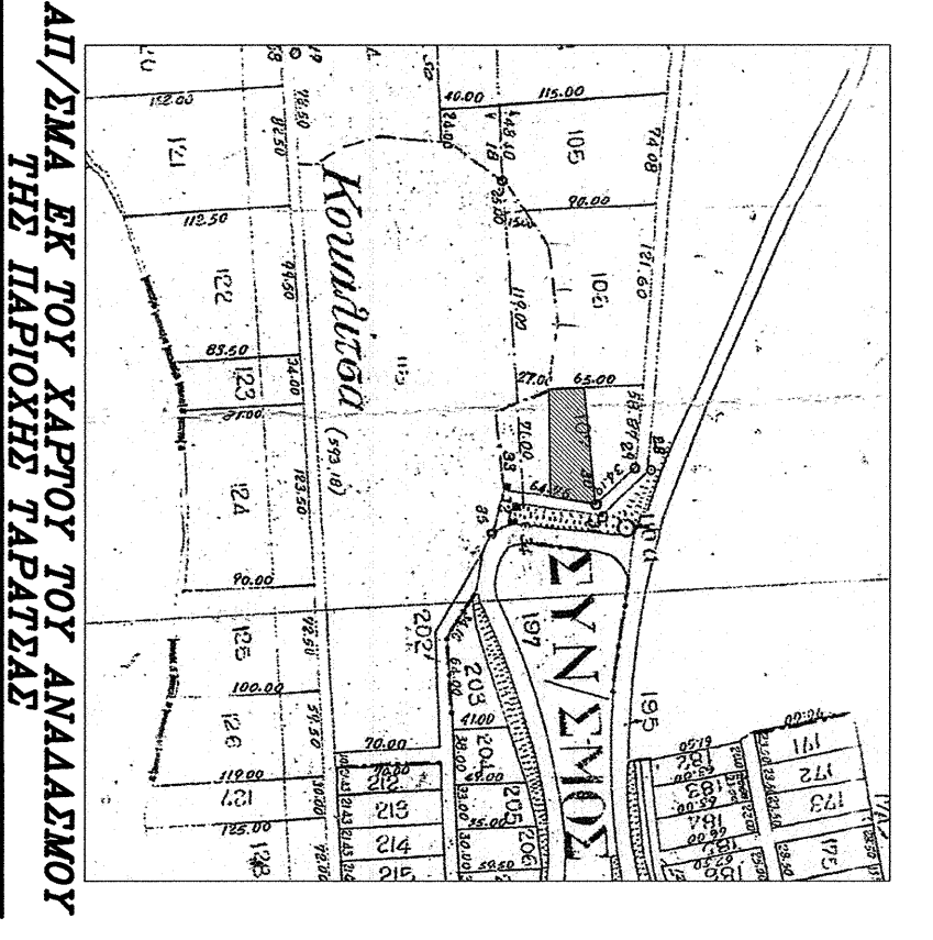
ΑΥΤΑ ΕΣ ΤΟΥ ΚΑΡΤΟΥ ΤΟΥ ΑΝΑΛΛΑΞΟΥ ΤΗΣ ΔΗΜΟΤΙΚΗΣ ΤΑΞΕΩΣ

ΔΗΛΩΣΗ ΙΔΙΟΚΤΗΤΗ (Ν.4030/2011) Ο κτώμεν υποστηρίζω τους δικαιωμάτων Ντομόλιος διότι ούτως ή άλλως τα όρια και υψομετρήσεις όρια του οικοπέδου με στοιχεία (ΑΒΓΔΑ) και με εμβαδόν 2193,47 μ 2 , που βρίσκεται επί αγροτικής οδού, εκτός οικόπεδου, κτηματικής περιφέρειας Ταξιδιού του δήμου Λαγμία της Π.Ε. φθινοπώρου, υφίστανται από εμένα και ενόψει των τελετών που διενεργήθηκαν στην ομόνοια μου και από τον κτώμεν της δημόσιας οδού που υφίστανται από τον κτώμεν της δημόσιας οδού. Ο ΔΗΛΩΝ