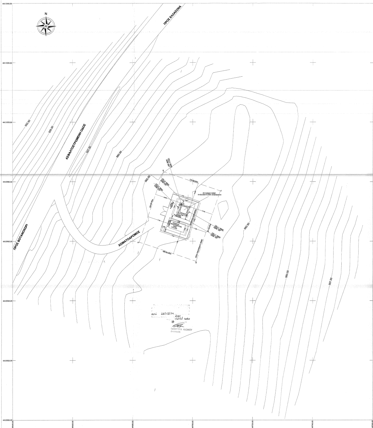
ΑΠΟΣΠΑΣΜΑ ΧΑΡΤΗ 1:5.000