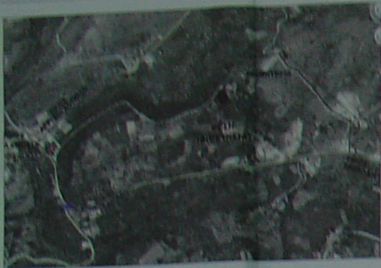
ΘΑΛΠΟΡΙΚΟ ΣΧΑΡΙΩΜΑ