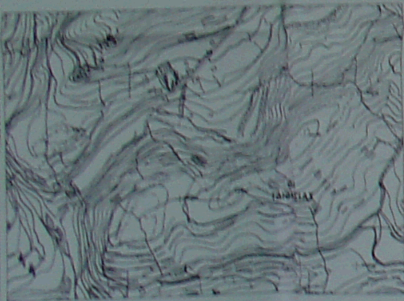
ΑΠΟΣΠΑΣΜΑ ΧΑΡΤΗ ΓΥΣ - ΑΡ ΦΥΛ ΧΑΡΤΗΣ 4