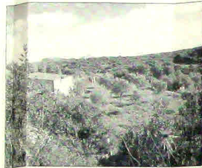
ΦΩΤΟΓΡΑΦΙΑ ΑΠΟ ΘΕΣΗ ΛΗΨΗΣ 3