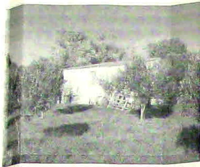
ΦΩΤΟΓΡΑΦΙΑ ΑΠΟ ΘΕΣΗ ΛΗΨΗΣ 2