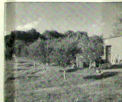
ΦΩΤΟΓΡΑΦΙΑ ΑΠΟ ΘΕΣΗ ΛΗΨΗΣ 4