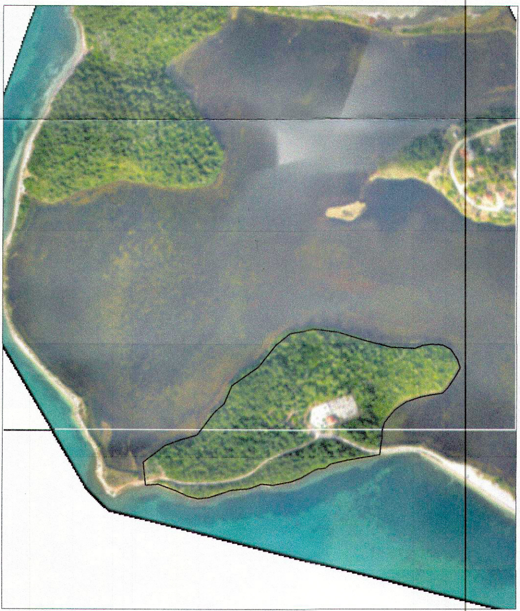
ΑΠΟΣΤΑΣΙΑ ΧΑΡΤΗ ΓΥΣ 1:50000