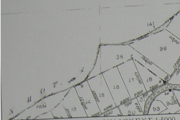
ΑΠΟΣΠΑΣΜΑ ΤΟΥ 3390-8 ΦΥΛΛΟΥ Γ.Υ.Σ 1:5000