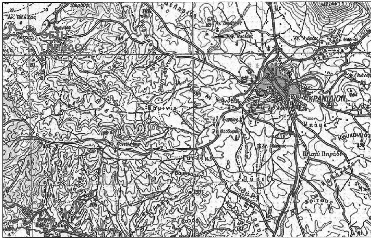
ΑΠΟΣΠΑΣΜΑ ΧΑΡΤΗ ΓΥΣ