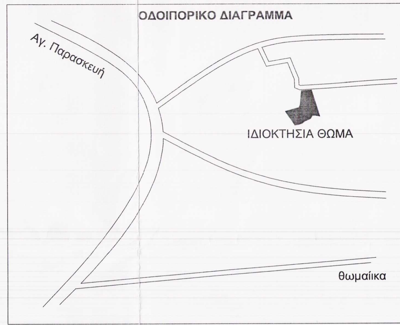
ΧΑΡΤΗΣ ΓΥΣ 1:5000