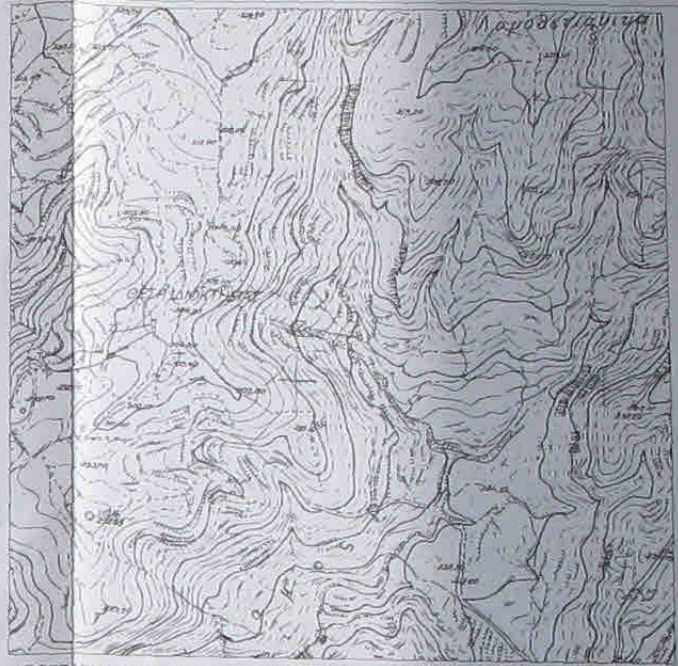
ΑΠΟΣΠΑΣΜΑ ΦΥΛΛΟΥ ΧΑΡΤΗ Γ.Υ.Σ. (ΑΡ. 83271) 1:5000

ΕΞΑΘΙΕΤΑ Η ΑΡΧΗ ΤΟΠΟΓΡΑΦΙΚΗ ΠΡΩΤΟΤΥΠΗ ΠΛΑΚΑΔΑ ΧΑΡΤΟΥ Κ.Σ. ΠΡ. ΑΡΧΑΙΟ ΚΑΤΑ Α ΕΣΤΙ ΑΠΟΤΕΛΕΣΜΑ ΔΙΟΡΘΩΣΕΩΣ ΧΑΡΤΗ ΚΑΙ ΠΡΟΣΑΡΤΗΤΑ ΕΙΝΑΙ ΤΟ ΠΡΩΤΟΤΥΠΟ Υ=Α-Β-Γ-Δ-Ε-Ζ-Η-Θ-Κ-Λ-Μ-Ν-Ξ-Ο-Π-Ρ-Σ-Τ-Α Ο ΜΗΧΑΝΙΚΟΣ