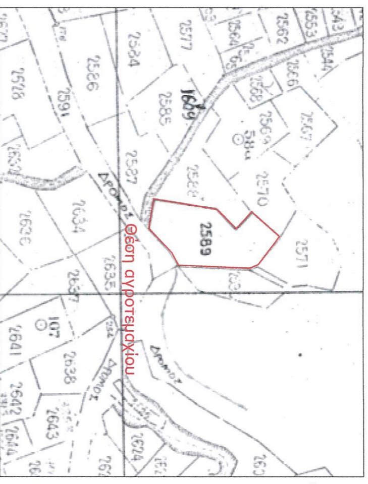
Απόσταση Χώρα - Διεύθυνση Αγροκτήματος Αψάλου Κλ. 1/5000

ΤΟ ΠΑΡΩΝ ΣΥΝΔΕΥΕΙ ΑΝΑΠΟΣΤΑΣΙΑ ΤΗΝ ΜΕ ΑΡΙΘΜΟ 2602/106-03-2015 ΠΡΑΞΗ ΧΑΡΑΚΤΗΡΙΣΜΟΥ ΤΟΥ ΔΑΣΑΡΧΗ ΑΡΜΑΔΙΑΣ Κ.Α.Ο. Κωνσταντίνος Ιωάννης Δασολόγος