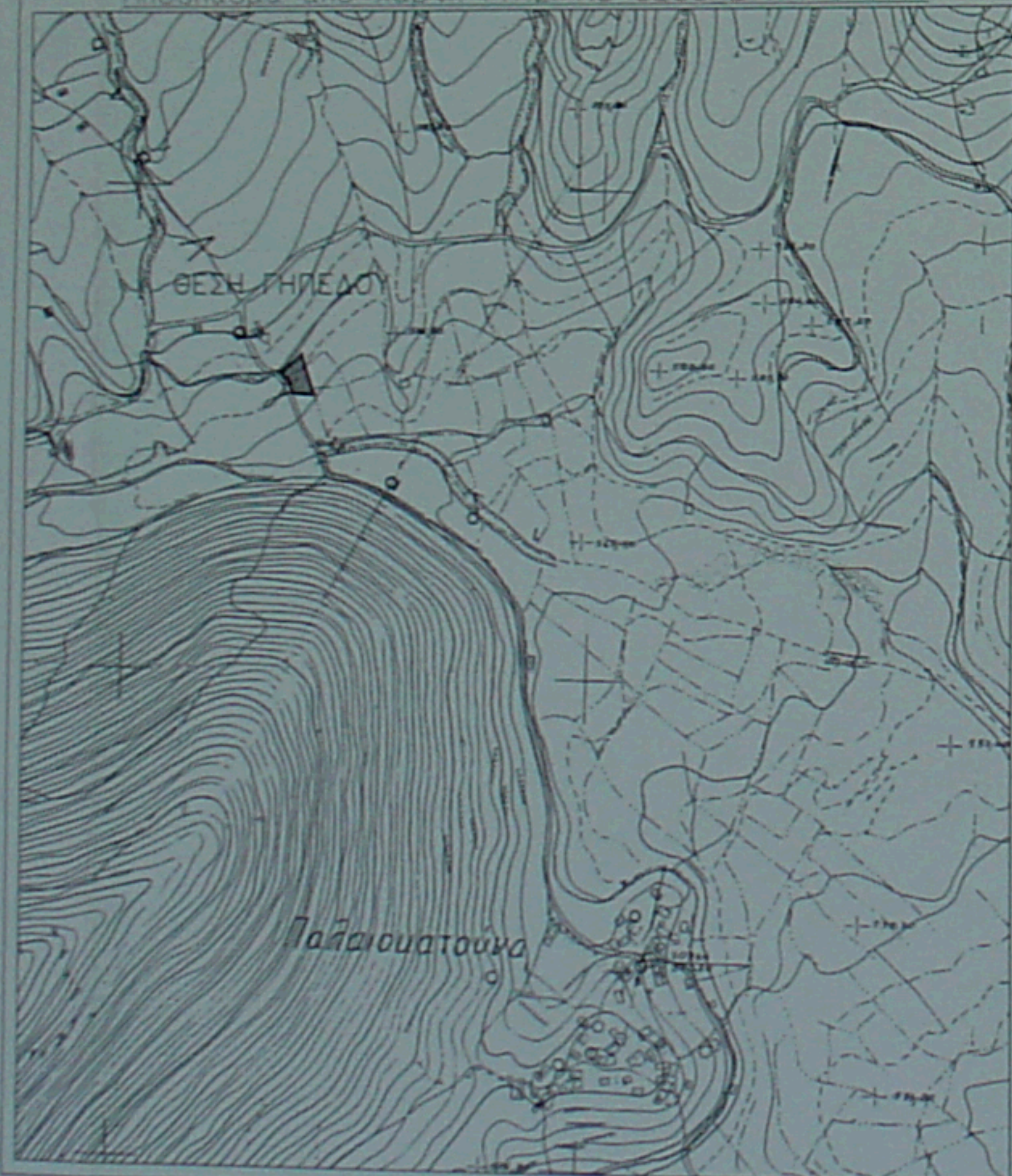
Απόσταση από χάρτη Γ.Υ.Σ. Νο 6268 2 ΚΑ: 1/5000

ΝΤΑΪΡΟΠΟΥΛΟΥ ΑΝΔΡ. ΒΑΣΙΛΗ ΑΡΧΙΤΕΚΤΩΝ ΜΗΧΑΝΙΚΟΣ ΠΑΝΕΠΙΣΤΗΜΙΟΥ ΝΕΑΠΟΛΕΩΣ ΠΑΡΜΑΣ ΜΕΛΟΣ Τ.Ε.Ε. Αρχιτ. Μητρώου 57192 Ρηγα Φωφωλάου 169, τ.κ. 262 22 Πάτρα Τηλ. 2610 333 661, Κηφ. 2230 464829 Α.Φ.Μ. 013316751 - Β' ΔΟΥ ΠΑΤΡΩΝ