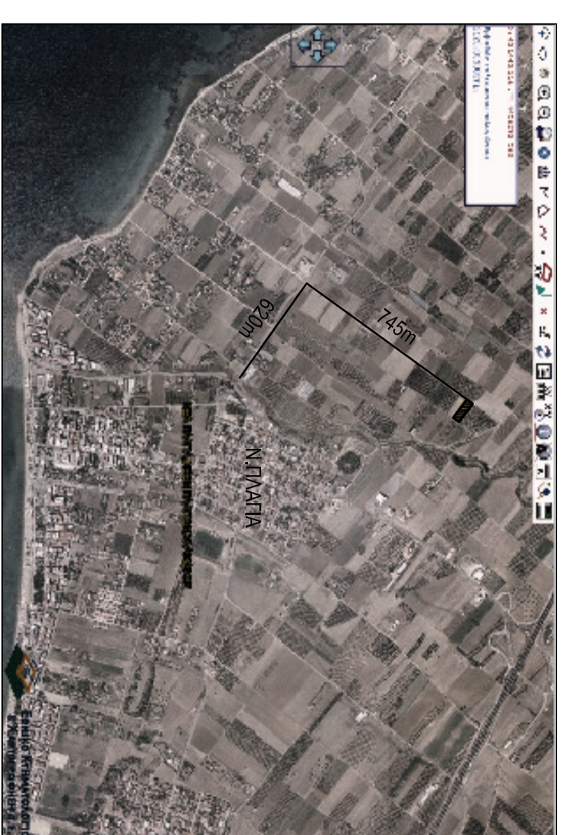
ΔΗΜΟΣ ΜΗΧΑΝΙΚΟΥ (Ν.651/77)