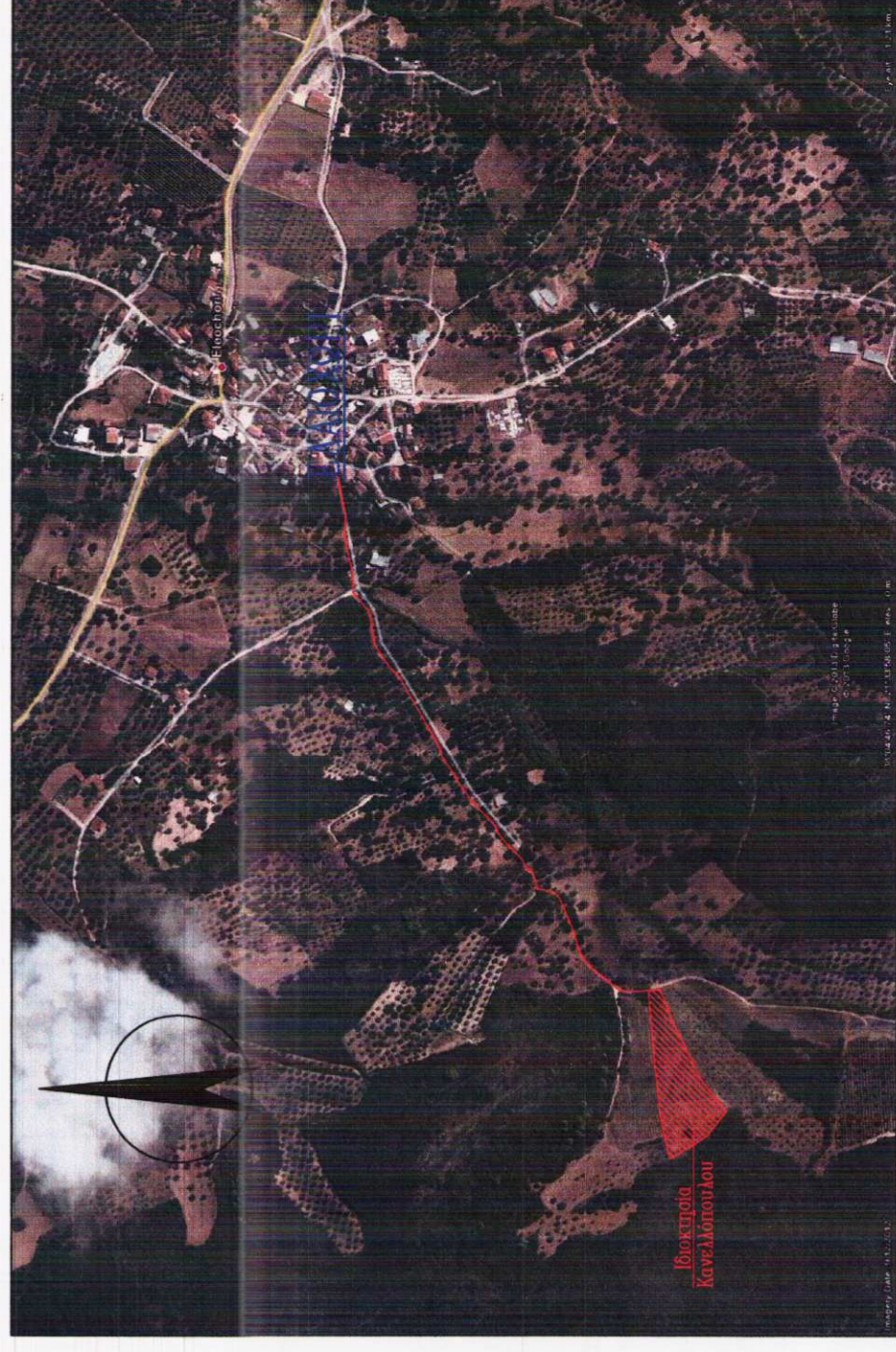
ΟΛΟΠΡΟΡΙΚΟ ΣΚΑΡΦΗΜΑ

Το παρόν τοπογραφικό διάγραμμα συνοδεύει τη βεβαίωση μηχανικού (Συμφώνα με την παρ.4 του άρθρου 23 του Ν.4014/2011 και την παρ. 16 του άρθρου 49 του Ν. 4030/2011) για μοναδικό αριθμό ακινήτου: 5C4AE2B6A8EA9598