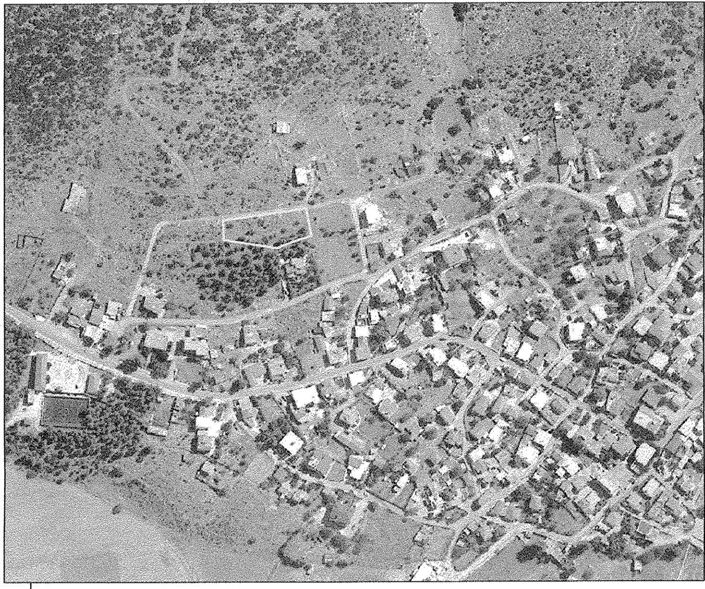
ΑΠΟΣΠΑΣΜΑ ΑΦ ΚΤΗΜΑΤΟΛΟΓΙΟΥ