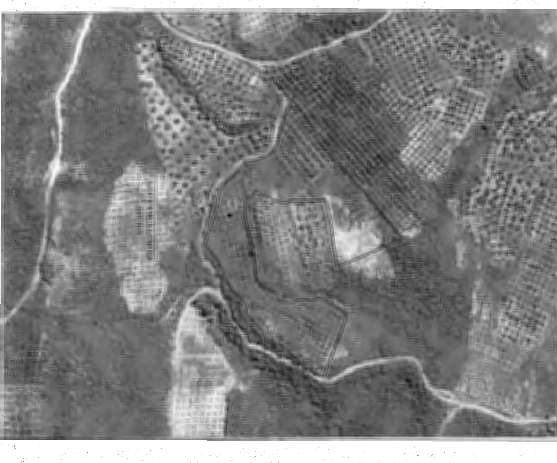
Απόσταση Δορυφορική Χάρτη