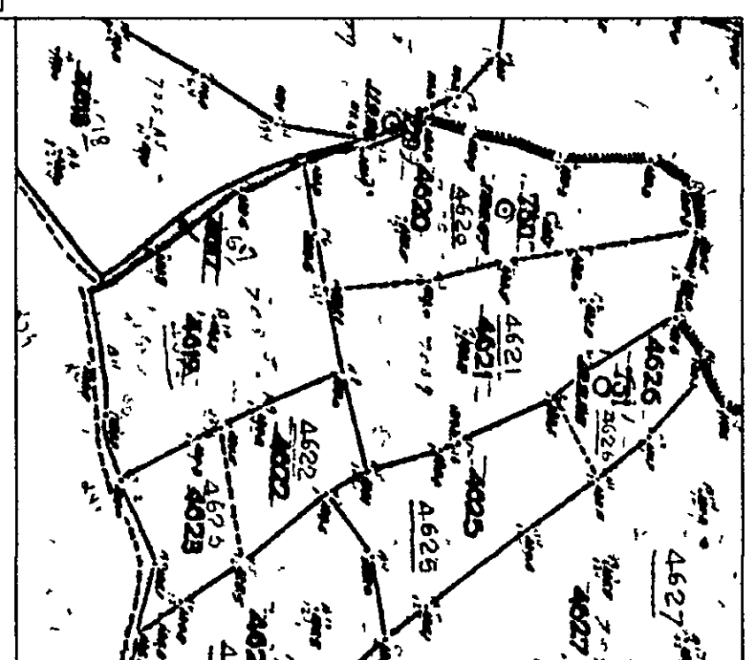
ΑΠΟΤΙΛΑΣΜΑ ΑΠΟΤΥΠΩΣΗΣ ΑΓΡΟΤΟΣ ΝΑΟΥΣΑΣ 1938 ΚΑΙΜΑΚΑ 1/2000

ΠΡΟΒΟΛΙΚΟ ΣΥΣΤΗΜΑ ΕΓΣΑ '87 ΣΥΝΤΕΛΕΣΤΗΣ ΓΡΑΜΜΙΚΗΣ ΠΑΡΑΜΟΡΦΩΣΗΣ ΠΕΡΙΟΧΗΣ K=0 999928