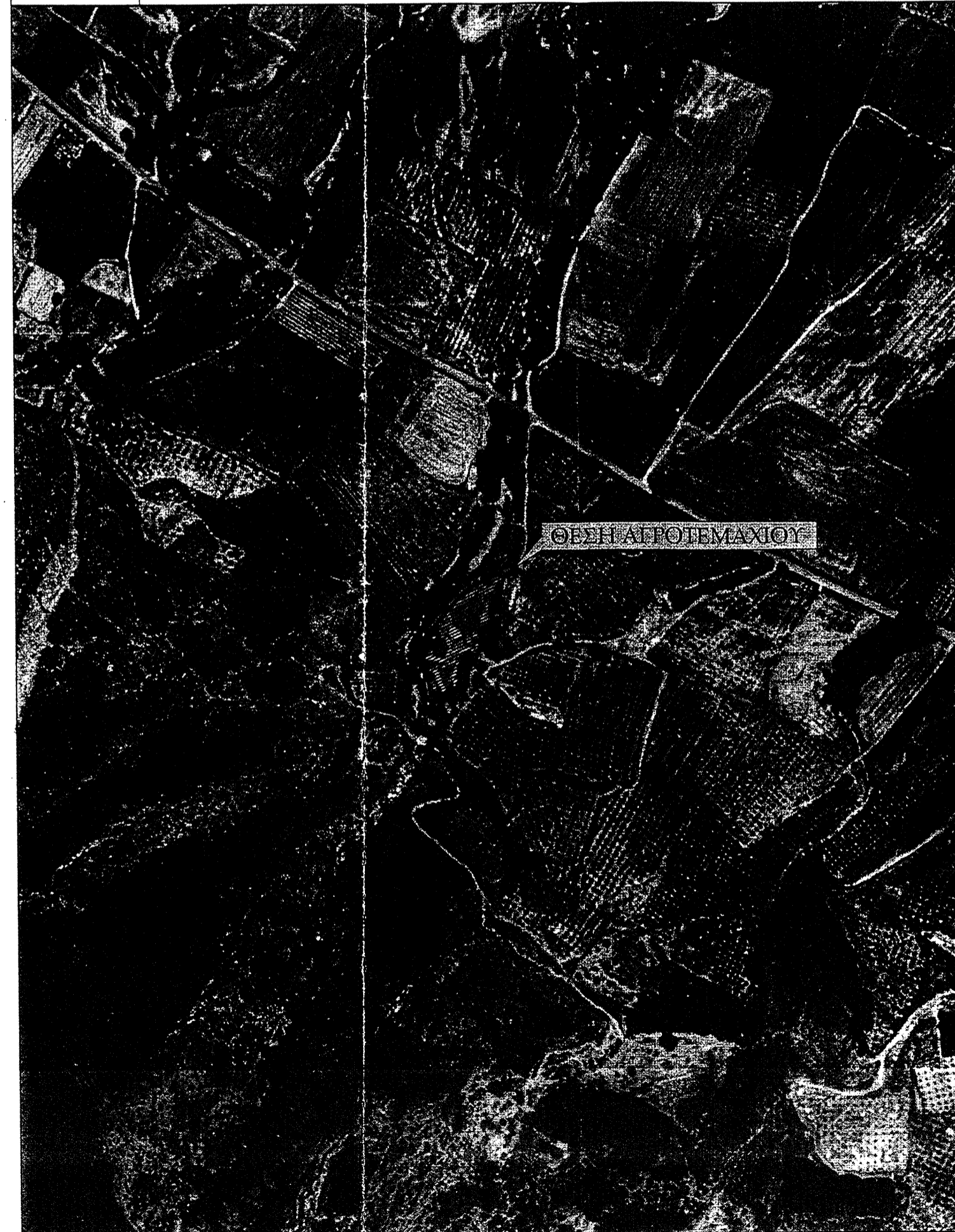
ΑΠΟΣΠΑΣΜΑ ΟΡΘΟΦΩΤΟΧΑΡΤΗ ΠΕΡΙΟΧΗΣ Δ.Δ. ΣΤΟΜΙΟΥ ΚΛΙΜΑΚΑΣ 1:5000