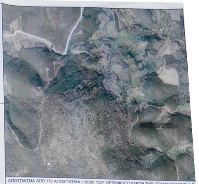
ΑΠΟΣΠΑΣΜΑ ΑΠΟ ΤΟ ΑΠΟΣΠΑΣΜΑ 1:5000 ΤΟΥ ΟΡΘΟΦΩΤΟΧΑΡΤΗΣ ΤΗΣ ΚΤΗΜΑΤΟΛΟΓΙΑΣ Α.Ε.

ΟΡΘΟΦΩΤΟΧΑΡΤΗΣ Π.Δ.Σ. 115-81/96Κ ΣΤ.Δ.Σ. 6 & 1012-24-123/96Κ Σ.Μ.Α. 11-12-03 Βασική κλίμακα: 1:5000 Το σχέδιο αποτελεί κείμενο, σχέδια, φωτογραφίες, αεροφωτογραφίες, σχέδια, κλπ. Η κλίμακα του σχεδίου είναι 1:5000. Η κλίμακα του σχεδίου είναι 1:5000. Η κλίμακα του σχεδίου είναι 1:5000. Η κλίμακα του σχεδίου είναι 1:5000.