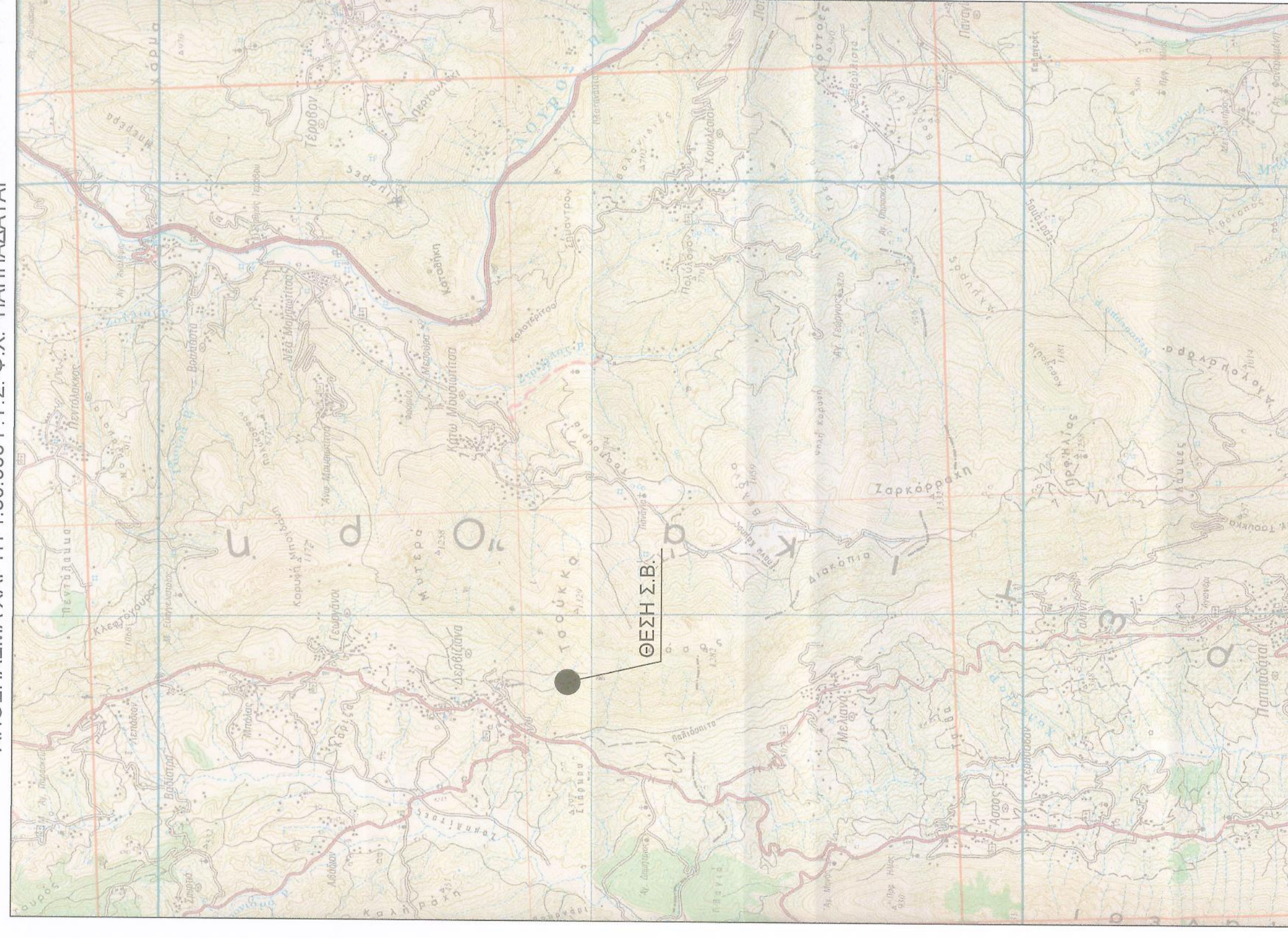
ΑΠΟΣΤΑΣΜΑ ΔΙΑΓΡΑΜΜΑΤΟΣ 1:5.000 Γ.Υ.Σ. Νο 51/52 Φ.Χ. 'ΠΑΠΠΑΛΑΤΑ'