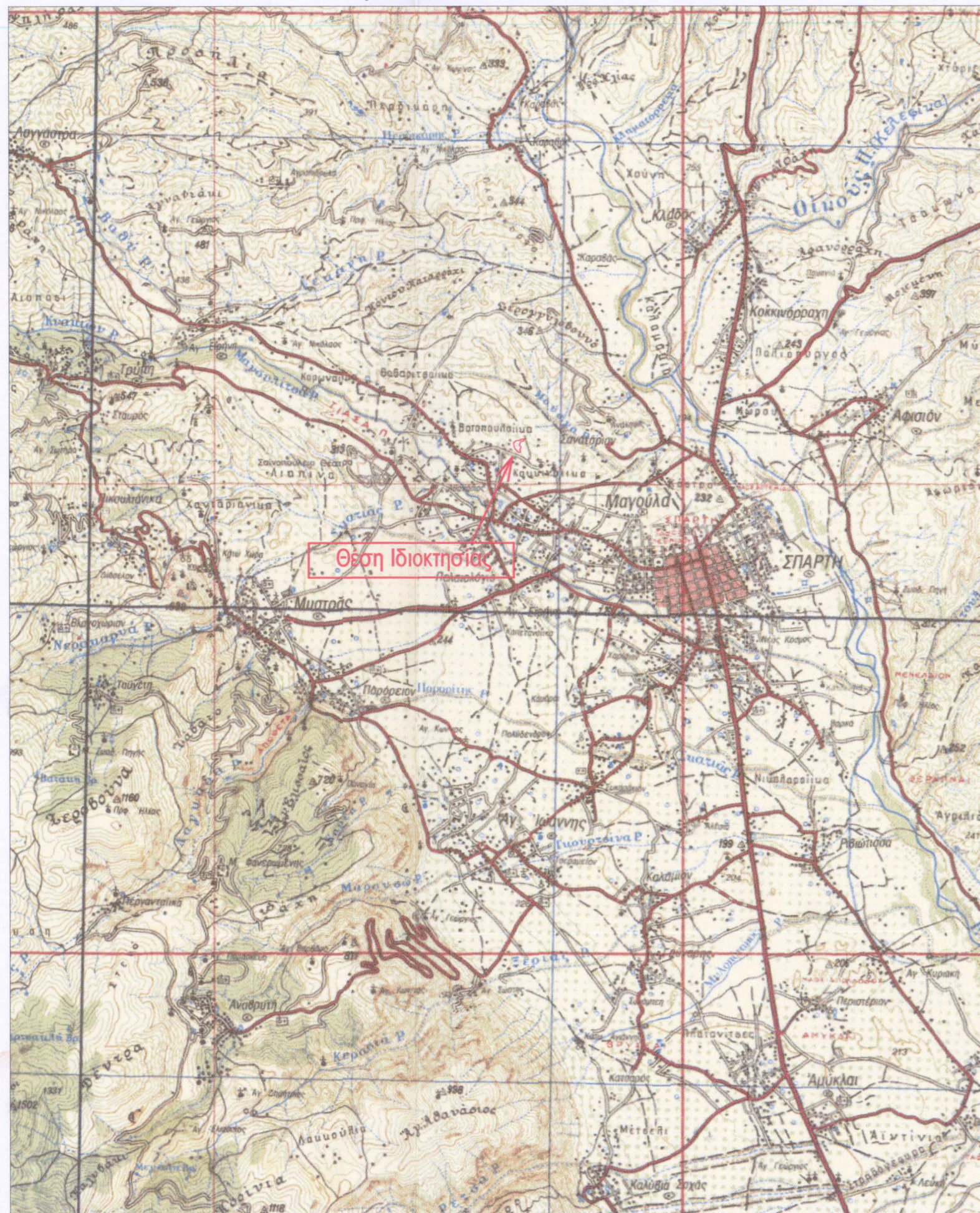
ΑΠΟΣΠΑΣΜΑ ΧΑΡΤΟΥ (Γ.Υ.Σ) 1:5000 Φύλλο: 7341-2