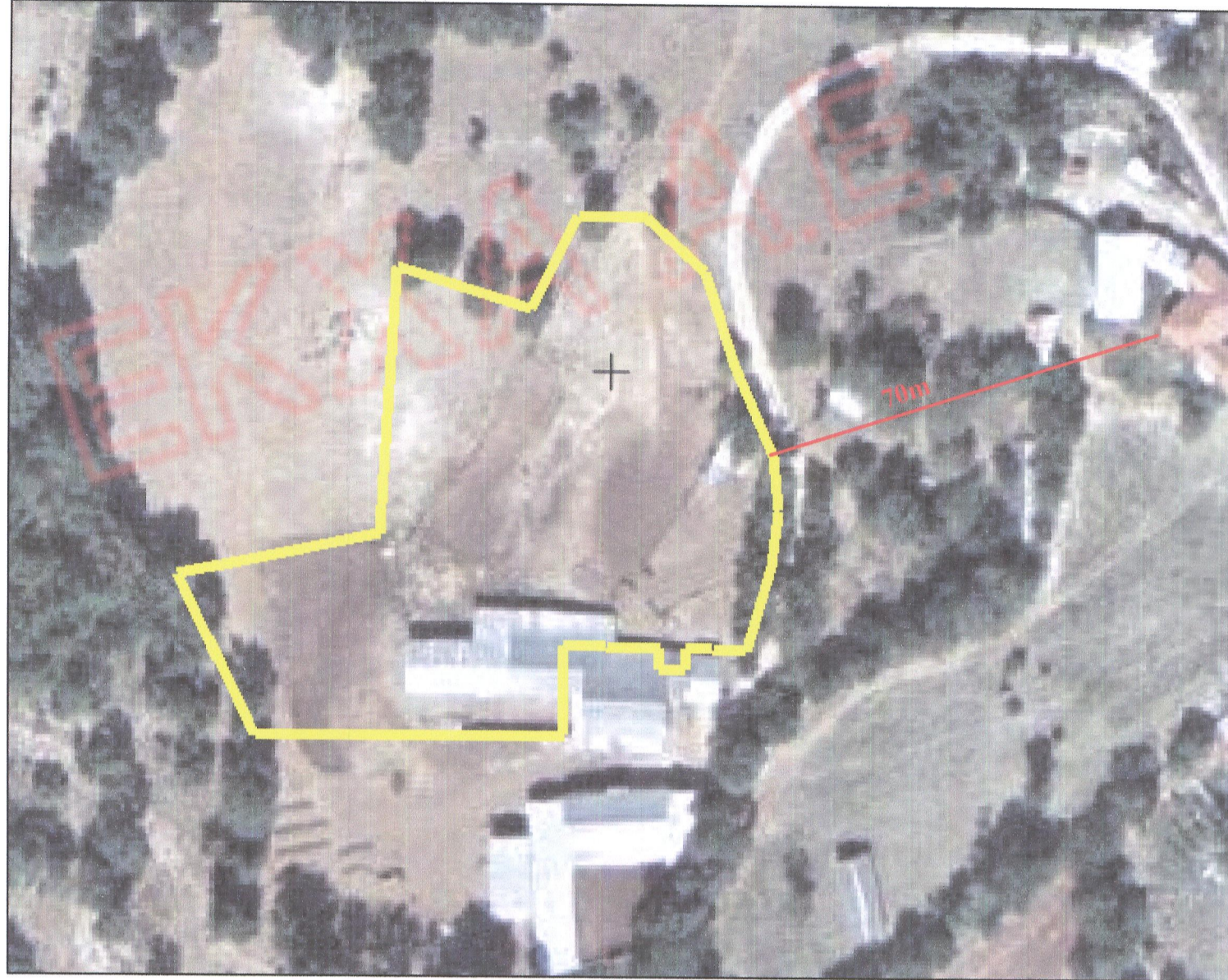
ΑΕΡΟΦΩΤΟΓΡΑΦΙΑ ΕΚΧΑ ΚΛ. 1:1.000