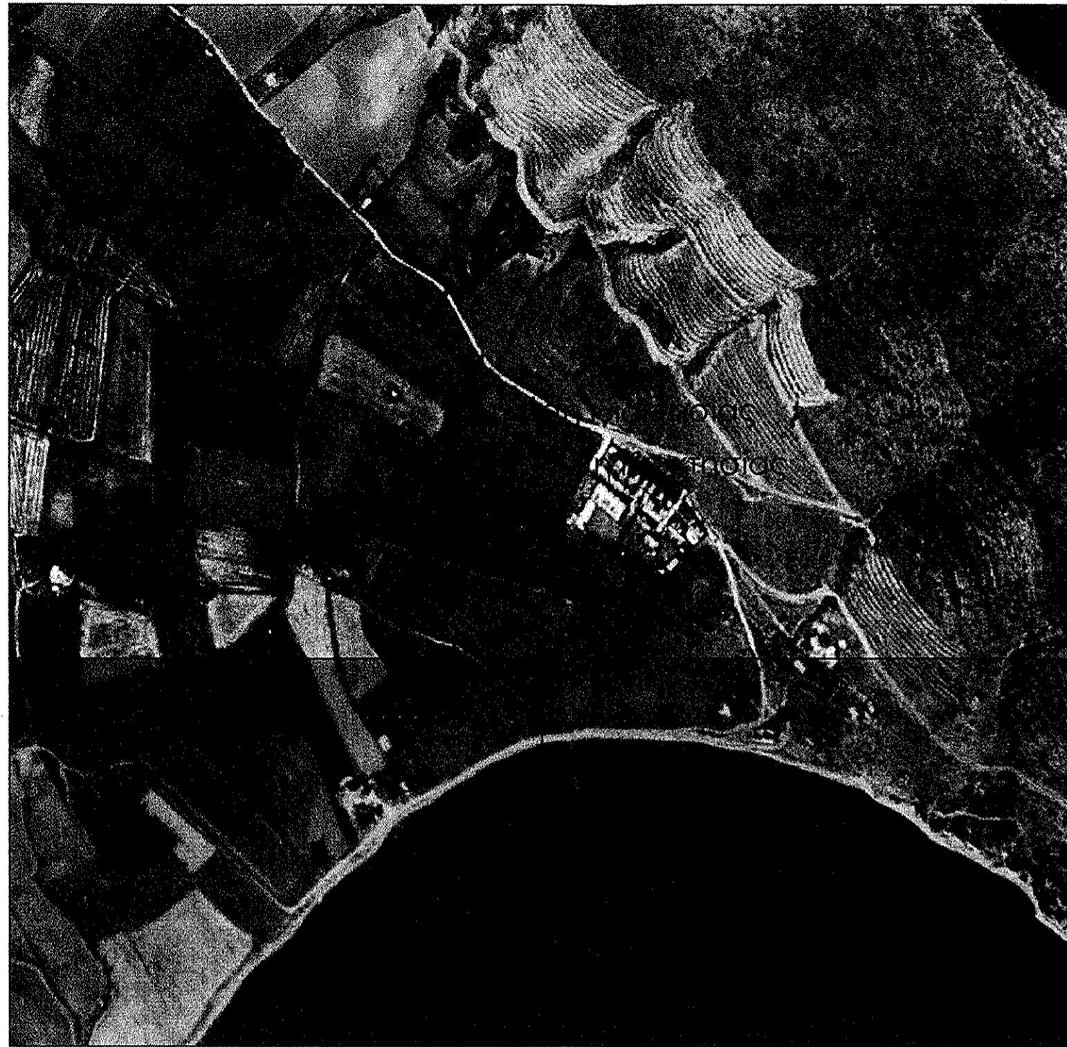
Απόσπασμα ορθοφωτοχάρτη Υπ.Γεωργίας (292-248 & 292-245)