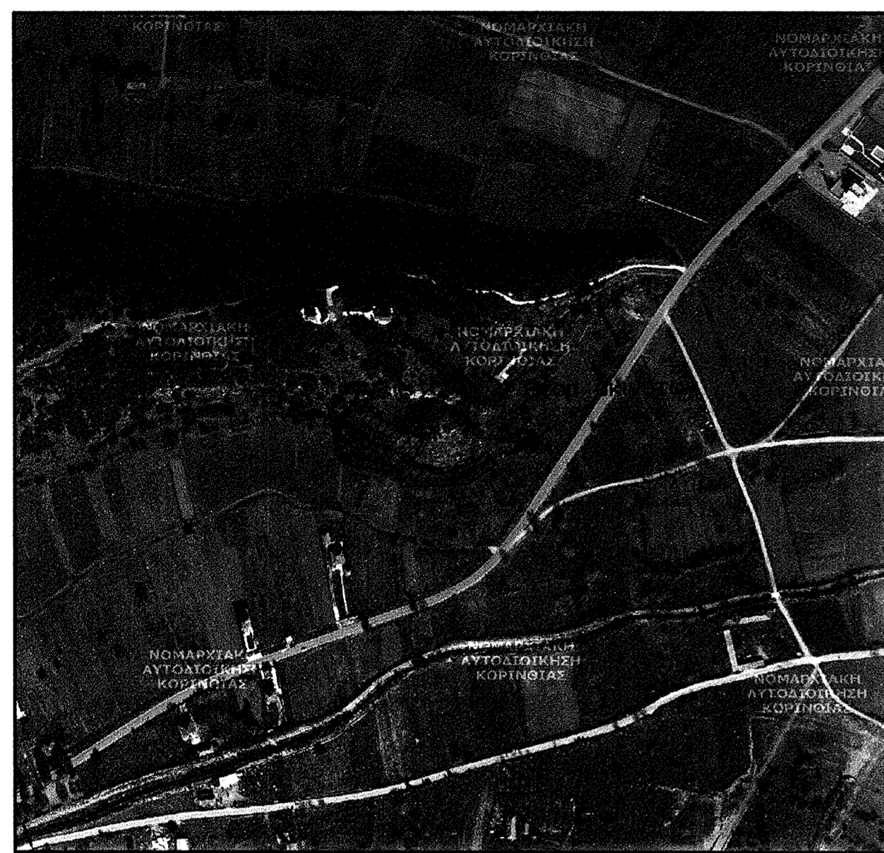
Απόσπασμα από αεροφωτογραφία (1:5000)