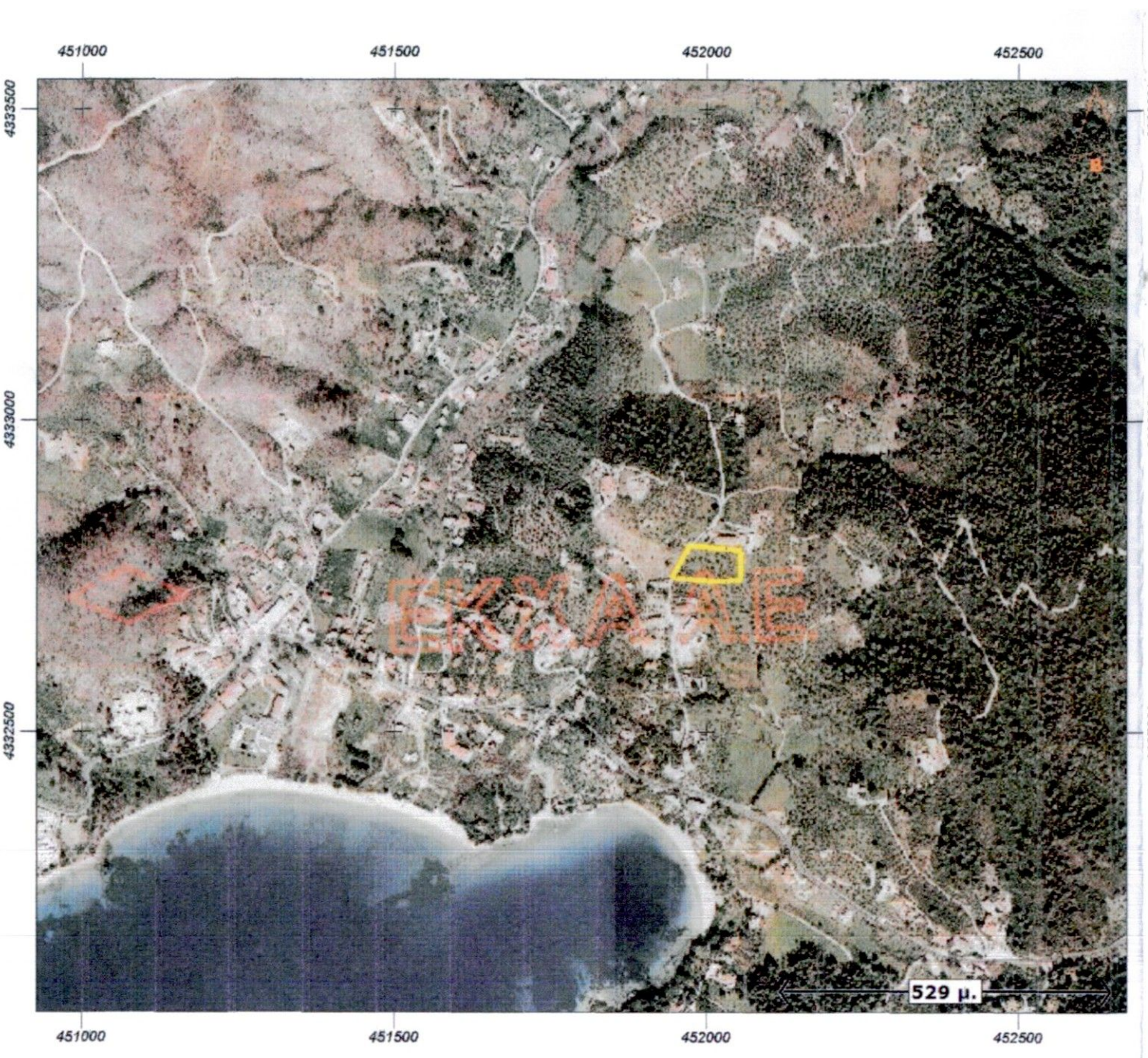
ΑΠΟΣΠΑΣΜΑ ΟΡΘΟΦΩΤΟΧΑΡΤΗ ΕΚΧΑ