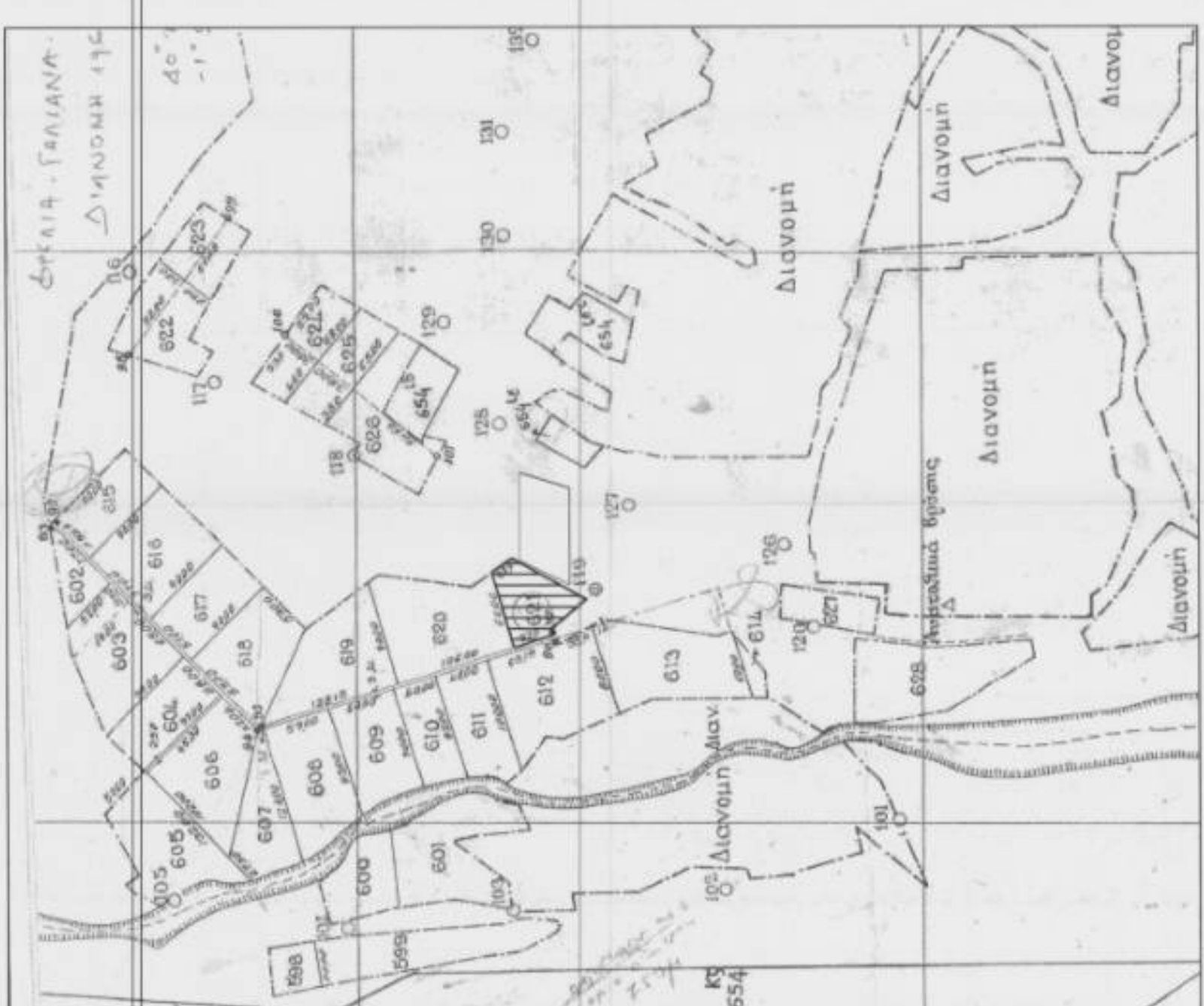
ΑΠΟΣΠΑΣΜΑ ΧΑΡΤΗ ΔΙΑΝΟΜΗΣ ΑΓΡΟΚΤΗΜΑΤΟΣ ΦΩΤΕΛΙΑ-ΓΑΛΛΙΑΝΑ ΚΟΖΑΝΗΣ (ΣΥΜΠΛ. ΔΙΑΝΟΜΗ 1964, L=40°21', M=-1°51')