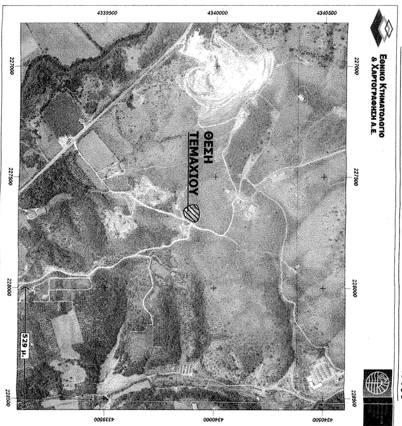
ΑΙΟΙΟΣΤΑΣΙΑ ΕΘΝΙΚΟΥ ΚΤΗΜΑΤΟΛΟΓΙΟΥ 1:5000