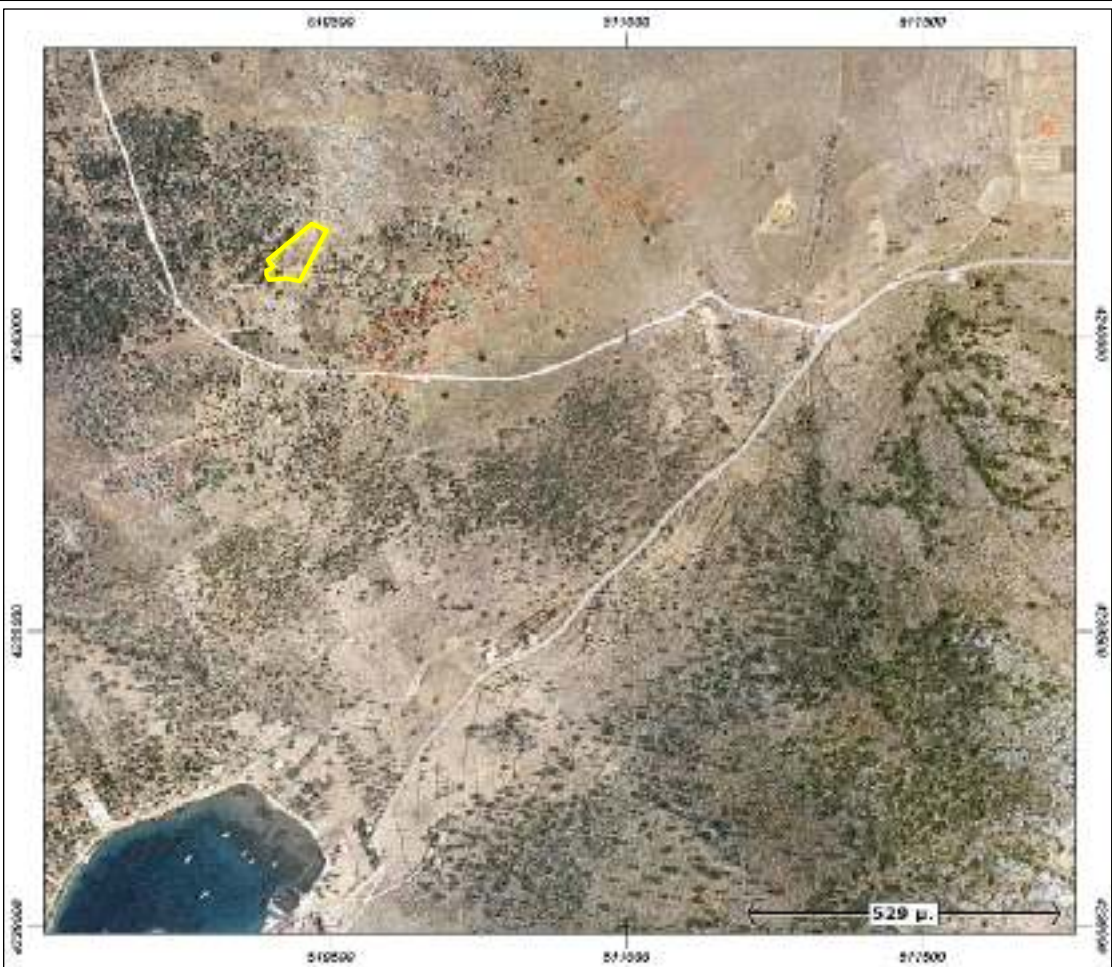
ΑΠΟΣΠΑΣΜΑ ΟΡΘΟΦΩΤΟΓΡΑΦΙΑΣ ΚΤΗΜΑΤΟΛΟΓΙΟΥ