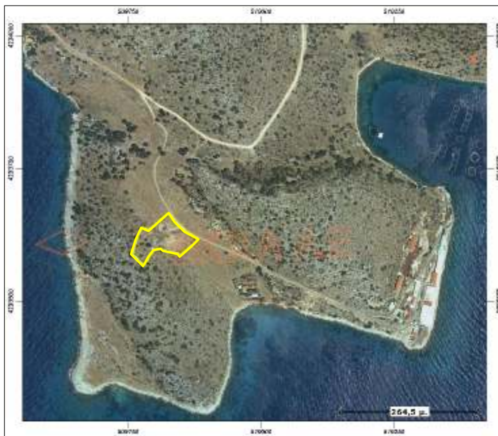
ΑΠΟΣΠΑΣΜΑ ΟΡΘΟΦΩΤΟΓΡΑΦΙΑΣ ΚΤΗΜΑΤΟΛΟΓΙΟΥ