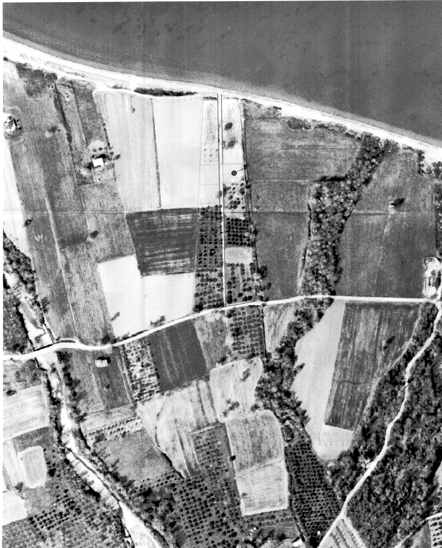
Απόσπασμα ορθοφωτοχάρτη 424-417 κλ= 1:2000 με την θέση του γεωτεμαχίου