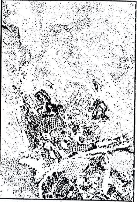
ΑΠΟΣΤΑΣΜΑ ΑΠΟ GOOGLE EARTH