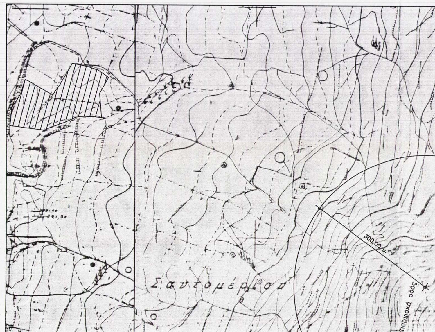
ΑΠΟΣΠΑΣΜΑ ΑΠΟ ΦΥΛΛΟ ΧΑΡΤΟΥ 6253 1 - 6253 2 ΚΛ. 1:5000