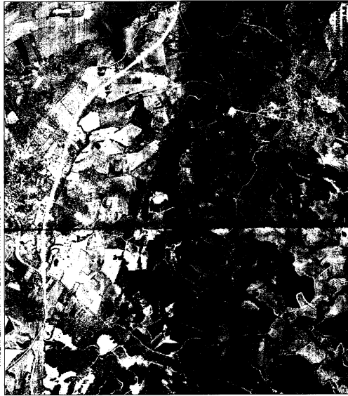
ΑΠΟΣΤΑΣΙΑ ΧΑΡΤΗ ΕΒΝΙΚΟΥ ΚΤΗΜΑΤΟΛΟΓΙΟΥ