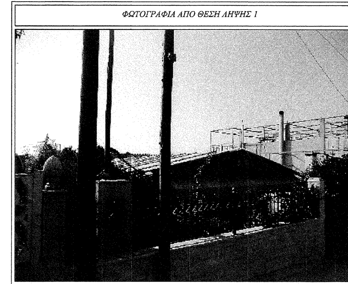
ΦΩΤΟΓΡΑΦΙΑ ΑΠΟ ΘΕΣΗ ΛΗΨΗΣ 1

ΙΕΡΟΘΕΟΣ ΒΑΣ. ΣΤΑΜΑΤΗΣ ΔΙΠΛ. ΠΟΛΙΤΙΚΟΣ ΜΗΧΑΝΙΚΟΣ ΠΟΛΥΤΕΧΝΙΚΗ ΣΧΟΛΗ ΠΑΤΡΩΝ ΠΑΤΡΩΝ ΜΕΛΟΣ Τ.Ε.Ε. ΑΡΧΙΤΕΚΤΟΝΩΝ ΚΑΙ ΣΤΡΟΦΟΔΟΤΩΝ ΑΓ. ΜΑΡΤΙΝΟΥ 2, ΑΓ. ΘΕΟΔΩΡΟΥ 2, Τ.Κ. 2740 6155 ΚΟΡΙΝΘΟΣ