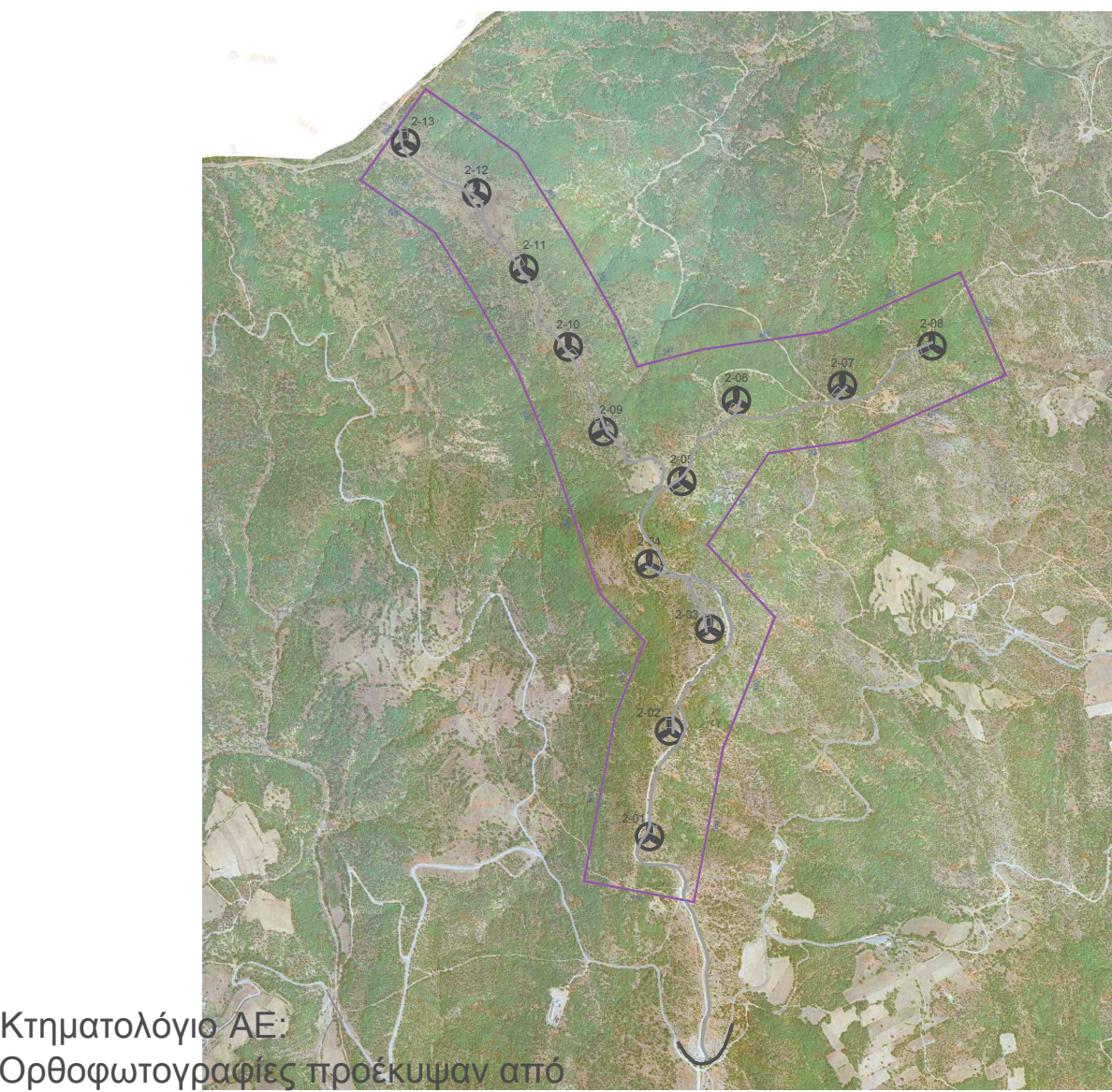
Κτηματολόγιο ΑΕ Ορθοφωτογραφίες προεκυψαν από φωτοληψίες περιόδου 2007 έως 2009

ΣΦΡΑΓΙΔΑ ΥΠΟΓΡΑΦΗ Υπεύθυνος Έργου : ΚΚ Υπεύθυνος Σχεδιασμού : ΚΚ