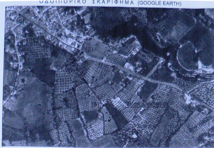
ΦΩΤΟΓΡΑΦΙΚΟ ΣΚΑΡΙΦΗΜΑ (GOOGLE EARTH)