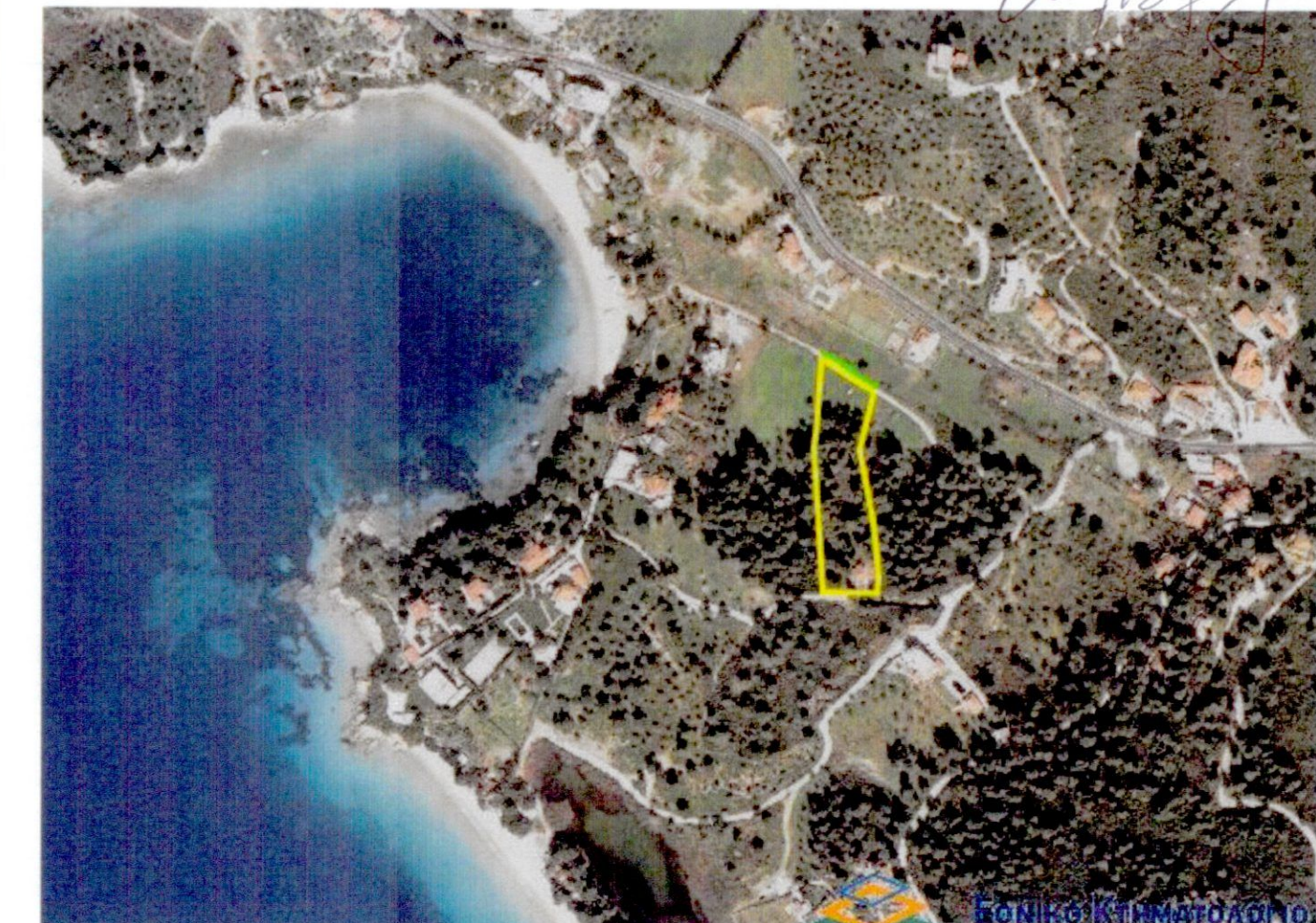
ΑΠΟΣΠΑΣΜΑ ΟΡΘΟΦΩΤΟΧΑΡΤΗ ΕΚΧΑ