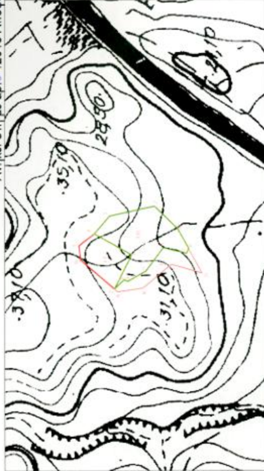
Συντεταγμένες κορυφών στο ΕΓΣΑ' 87

Ανήκει στη με αρ. 9 /2015 Απόφαση της ΕΕΔΑ Πρωτοδικείου Ρόδου