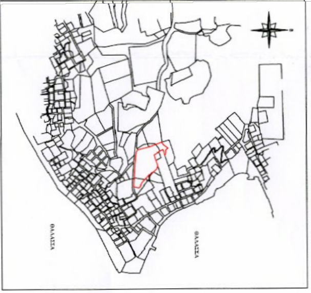
ΑΠΟΣΤΑΣΙΑ ΚΤΗΜΑΤΟΛΟΓΙΚΟΥ ΧΑΡΤΗ ΣΥΜΗΣ Το παρόν σχεδιάγραμμα αποτελεί σμίκρυνση του πρωτοτύπου σε διαστάσεις Α3