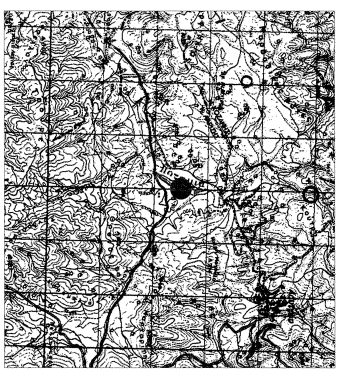
Στο κέντρο υπάρχει σημείο. Υψη βλ. στην 1) ιδιοκτησία Παναγιώτα Κουκουρέτση

ΠΡΑΓΜΑΤΟΠΟΙΟΥΜΕΝΑ ΣΤΟΙΧΕΙΑ ΔΟΜΗΣΗΣ 0) ΔΟΜΗ 1) - ΠΟΛΙΜΟΝΟΤΗΤΑ: Ε=4,87*0,00=120,00 t.t. ΣΥΝΟΛΙΚΗ ΔΟΜΗΣΗ = 120,00 t.t.