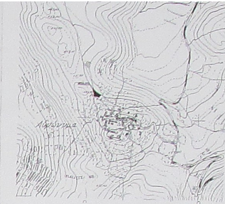
ΑΠΟΣΤΑΣΙΑ ΧΑΡΤΗ Γ.Υ.Σ. ΑΠΟΣΤΑΣΙΑ ΔΙΑΓΡΑΜΜΑΤΟΣ 1:50.000