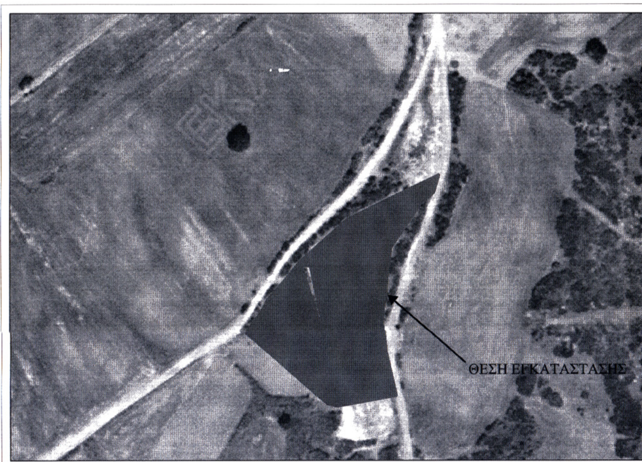
ΑΠΟΣΠΑΣΜΑ ΟΡΘΟΦΩΤΟΧΑΡΤΗ ΚΛΙΜΑΚΑΣ 1:2000