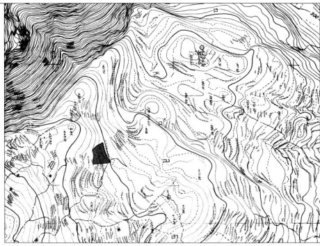
ΑΝΟΙΧΤΑ ΜΑΡΤΙΑ ΓΥΣ 5164 - 7 ΚΑΜΑΚΑ 15.000 - ΒΕΝΗ ΜΟΡΤΙΝΙΔΕΣ ΑΠΟΤΥΠΩΣΗ ΜΠΟ ΘΑΛΑΣΣΙΑ 1:50.000